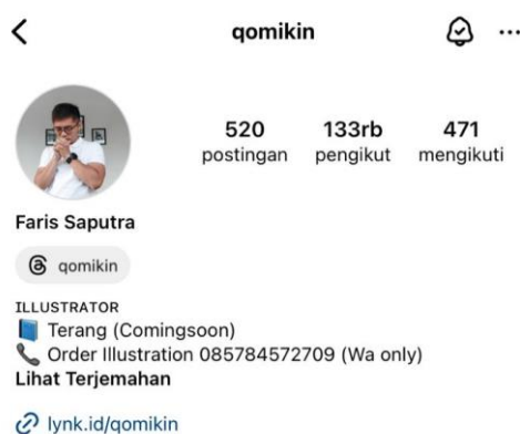
Gambar 1. Akun Instagram Qomikin

Faris juga berkecimpung dalam industri kreatif dengan membuat studio yang diberi nama @qomikin yang terpantau aktif membuat karya ilustrasi, karya ilustrasi nya juga sudah dijual belikan di marketplace desain grafis yang berlabel Creative Market . Pria yang berdarah Mojokerto, Jawa Timur tersebut juga mulai merambah ke dalam dunia menulis dan telah menciptakan karya tulis yang ia tuangkan ke dalam sebuah buku. Judul buku yang sudah terbit diantaranya Setelah Amnesia jadi manusia, Rindu Yang Menipu dan yang sedang dalam progres yaitu Tenang Yang Kau Cari Bukan Disini.