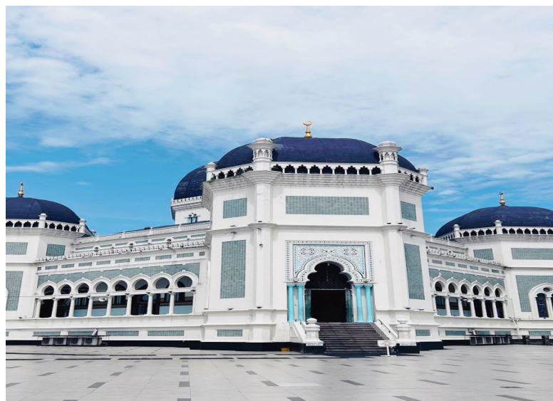
Gambar 1. Masjid Raya Al-Mashun Kota Medan

Masjid Raya Al-Mashun adalah masjid yang berada di Kota Medan sebagai salah satu ikon bersejarah dari Kesultanan Deli. Masjid Raya Al-Mashun menjadi salah satu tempat untuk kunjungan pariwisata. Banyak wisatawan datang ke Masjid Raya Al-Mashun mulai dari anak sekolah, mahasiswa, wisatawan dalam maupun luar negeri banyak berkunjung. Kegiatan pariwisata yang ada di Masjid Raya Al-Mashun memiliki dampak positif maupun negatif.