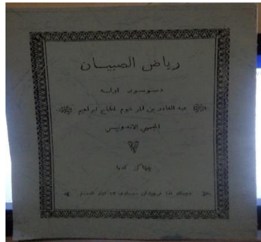
Gambar 2: Kitab Syair Al-Huiriyah

Penyampain syair ini dilakukan kepada murid-murid beliau dan masyarakat luas. Beliau membuat syair ini masa perjuangan rakyat Jambi melawan militer Belanda. Hal ini dilakukan dengan mengobarkan dan memberi semangat bagi rakyat Jambi untuk berjuang.