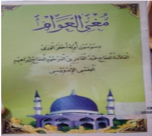
Gambar 1: Kitab Syair Mughnil 'Awâm

Karya syair selanjutnya yaitu kitab syair Riyadhus Shibyan, kitab ini berisi dasar-dasar ilmu Nahwu. Kitab ini merupakan kitab yang wajib dihafalkan oleh para santri madrasah As'ad yang baru mulai mempelajari ilmu Nahwu. Kitab ini sampai sekarang tetap dipelajari dan digemari oleh para santri madrasah As'ad karena kitab ini berbahasa Arab Melayu yang disusun dengan bait-bait syair. Metode mempelajari dan menghafal kitab ini dengan cara dilagukan (dinyayikan), sehingga para santri pemula tidak bosan dalam mempelajari ilmu Nahwu dan memahami kitab dasar-dasar ilmu Nahwu berbahasa Arab.