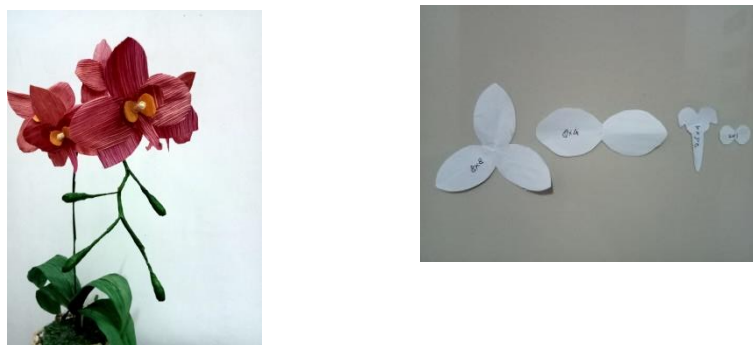
Gambar 5. Produk dalam bentuk bunga anggrek dan pola pembuatan bunga

Bunga dari kulit jagung dibuat dengan cara menggabungkan beberapa kulit jagung yang digunting sesuai pola, pencetakan pola pada kulit jagung dilihat berdasarkan serat pada kulit jagung. Pola bunga yang sudah jadi dapat dirangkai menjadi bunga buatan (artifisial) yang mirip dengan bunga asli, bunga ini bisa dijadikan bros dan mainan kunci.