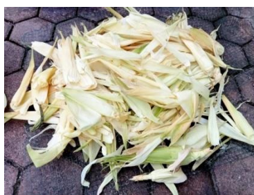
Gambar 1. Kulit jagung yang akan diolah

Setiap tanaman jagung memiliki tongkol jagung yang lapisi oleh kulit jagung yang berlapis-lapis dan setiap lapisan memiliki ketebalan dan kelenturan yang berbeda-beda (Hasdiana, 2018). Apabila dikelompokkan, maka lapisan kulit jagung terbagi menjadi tiga lapis, yaitu lapisan luar, lapisan tengah dan lapisan dalam. Rata-rata lebar kulit jagung berkisar 10-22 cm dan panjang 18-25 cm, berwarna hijau tua, hijau muda atau hijau pucat dan putih (Hasan, Halid, and Hasdiana, 2021).