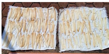
Gambar 2. Pengeringan kulit jagung dipisahkan perhelainya

Kulit jagung yang telah dicuci dan diwarnai kemudian dijemur dibawah sinar matahari, sebaiknya pada jam 09.00 – 12.00 WIB atau diangin-anginkan saja, hal ini bertujuan agar kulit jagung terjaga elastifitasnya. Penjemuran tidak dengan cara menumpuk kulit jagung pada tempat yang beralas saja, namun dipisahkan perhelainya agar pengeringan terjadi dengan sempurna.