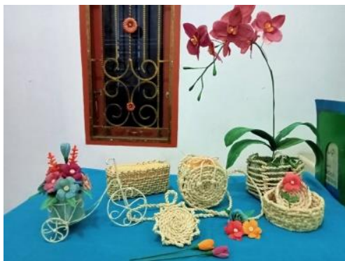
Gambar 8. Beberapa produk akhir cenderamata dari bahan baku kulit jagung