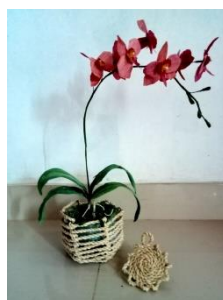
Gambar 8. Teknik pilin dan jalin serta produk yang dihasilkan (vas bunga dan tatakan gelas)