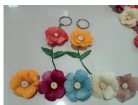
Gambar 6. Produk bunga yang dikreasikan menjadi bros dan mainan kunci