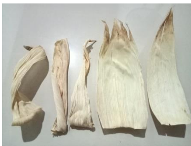
Gambar 3. Keadaan kulit jagung sebelum dan setelah disetrika.