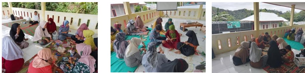
Gambar 4. Pendampingan pembuatan cenderamata dalam kelompok kecil

Peralatan yang digunakan dalam pembuatan cenderamata dari kulit jagung seperti: dawai, floral tape, tang potong, pisau, penggaris, floral foam, gunting, lem tembak, lem kayu, glue gun, jarum jahit, benang jahit, benang nilon, kain untuk pooring, resleting dan tali kur. Khusus untuk pembuatan vas bunga, dompet, tas dan tempat tatakan membutuhkan air sebagai pelembab alami pada kulit jagung yang kering sehingga teknik pilin dan jalin dalam pembuatan produk mudah dilakukan.