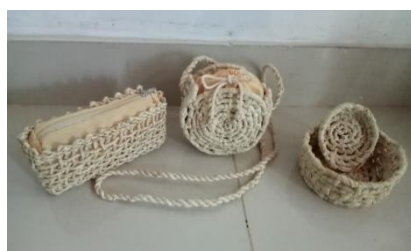
Gambar 7. Teknik pilin dan hasil produk