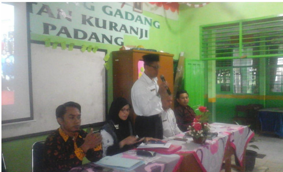
Gambar 2 . Kerjasama antara Kepala Sekolah dengan Tim