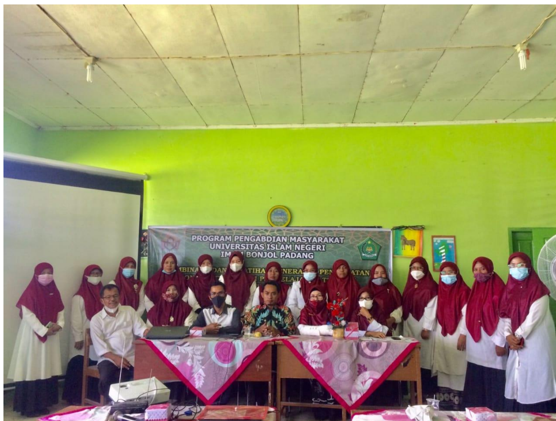
Gambar 4, 5, 6. Pelatihan penerapan pendekatan kontekstual dan pembelajaran tematik