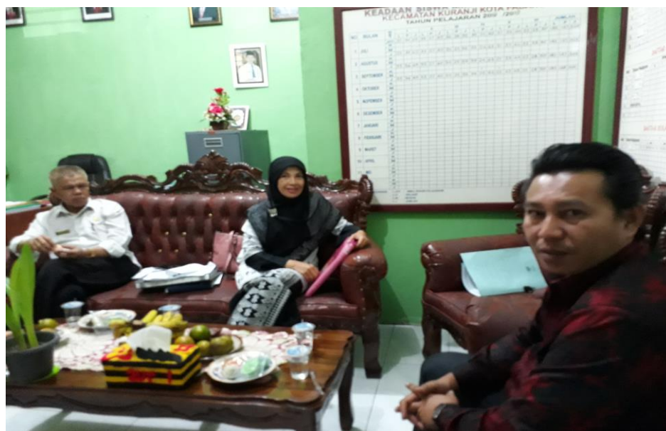
Gambar 3. Kerjasama antara Kepala Sekolah dengan Tim