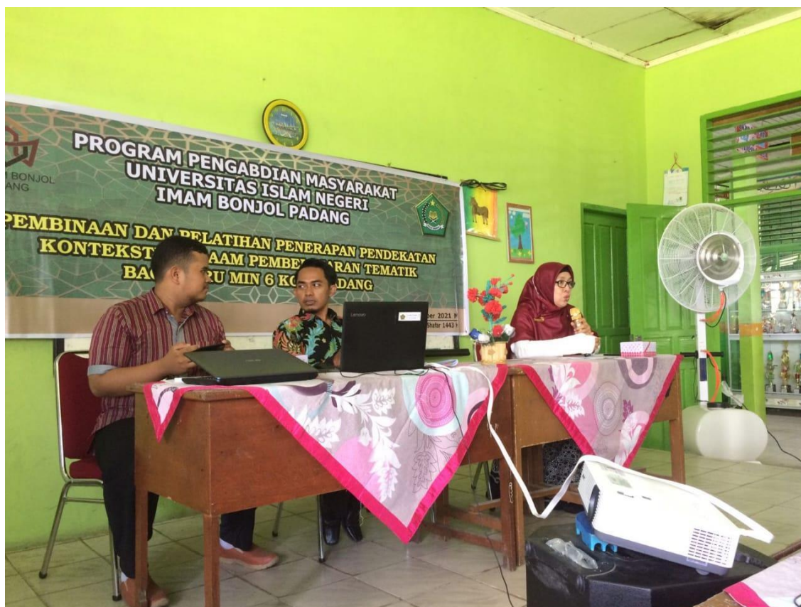
Gambar 1. Kegiatan sosialisasi program