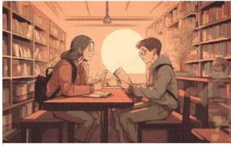
Gender Exercises For Arabic Grammar