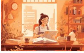
Dual Form Exercises For Arabic Grammar