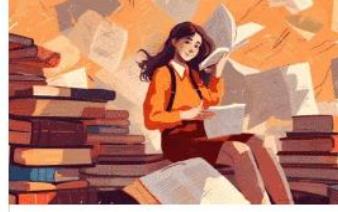
Broken Plurals Exercises For Arabic Grammar