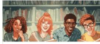
Plural Exercises For Arabic Grammar