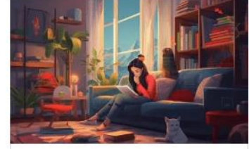
Countable and uncountable nouns Exercises For Arabic Grammar