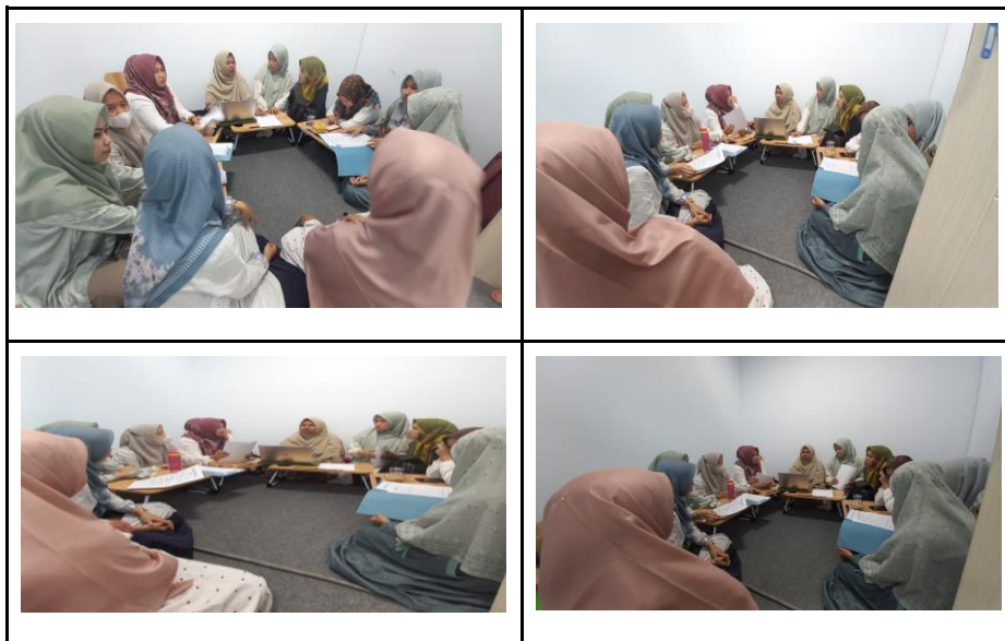
Gambar 3. Kegiatan penyusunan RPS

Hasil analisis tersebut menjadi pertimbangan dalam penyusunan RPS ( lesson plan ) sehingga menghasilkan RPS yang layak digunakan dalam perkuliahan. RPS yang dihasilkan pada tahapan ini merupakan RPS pada mata kuliah inti yang wajib diambil mahasiswa Program Studi Tadris Matematika, Fakultas Tarbiyah dan Keguruan UIN STS Jambi pada semester V (Lima) yakni mata kuliah Media Pembelajaran Matematika.