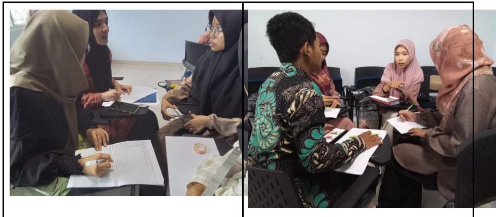
Gambar 4. Aktivitas pembuatan prototype

Pada aktivitas sharing task mahasiswa diminta untuk membuat prototype media pembelajaran yang akan dibuat. Media pembelajaran matematika yang akan dibuat merupakan media pada materi pecahan. Untuk membuka wawasan pengetahuan serta ide kreatif mahasiswa dosen model terlebih dahulu menayangkan sebuah media pembelajaran matematika materi pecahan. Dosen model bersama observer sebagai fasilitator mamandu dan menghubungkan aktivitas mahasiswa dalam kelompoknya apabila ada mahasiswa yang mengalami kesulitan atau tidak paham dan mahasiswa yang tidak bersemangat untuk mengikuti kegiatan. Pada saat mahasiswa mengerjakan kegiatan sharing task , mahasiswa mengerjakan dengan tenang. Tugas observer selama proses sharing task berlangsung yakni mengobservasi mahasiswa merancang prototype , satu observer bertugas mengobservasi satu kelompok, hal demikian diterapkan agar observer bisa fokus mengidentifikasi fenomena-fenomena yang terjadi pada masing-masing kelompok agar pada tahap refleksi nanti informasi yang diperoleh lebih detail dan dapat disusun secara sistematis.