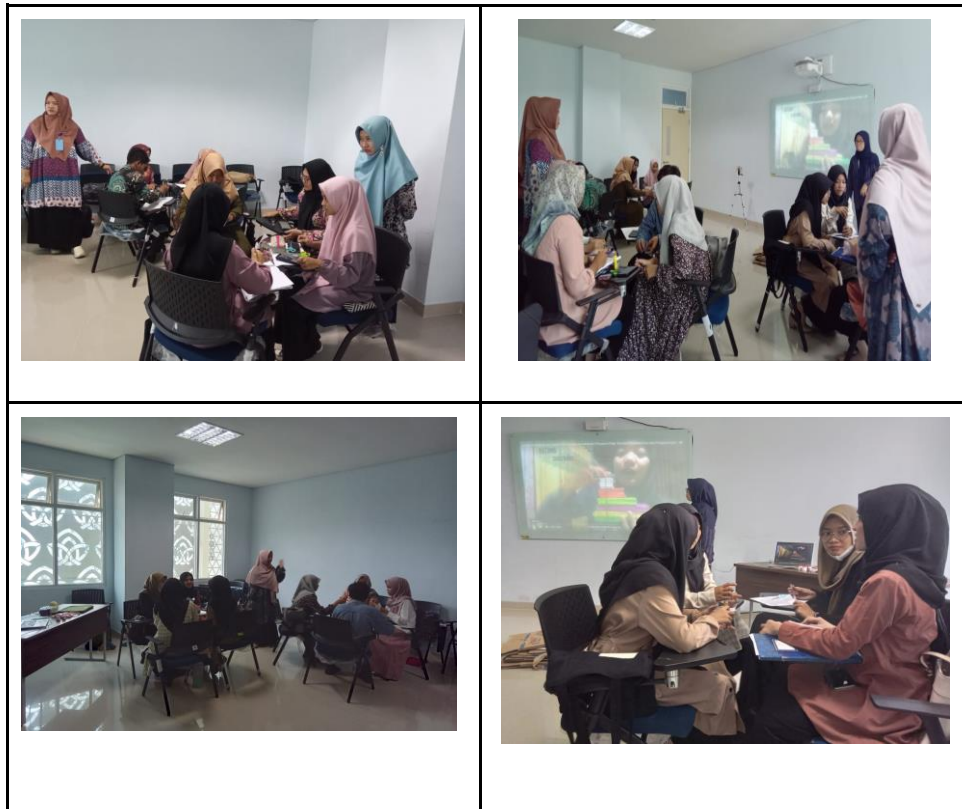
Gambar 6. Proses pembuatan media

Pada aktivitas 2 yakni mahasiswa melakukan kegiatan jumping task yakni pembuatan media pembelajaran matematika materi pecahan dan mempresentasikan hasil kerja kelompok. Mahasiswa dalam membuat media pembelajaran terlihat masing-masing kelompok bekerja sama fokus menyelesaikan media sesuai dengan prototype yang sudah dirancang sebelumnya. Setelah selesai membuat media dosen pengajar memberikan kesempatan kepada salah satu perwakilan kelompok untuk mempresentasikan hasil kerja mereka selama aktivitas berlangsung, sementara mahasiswa yang lainnya memperhatikan penjelasan temannya, memberikan tanggapan, komentar atau saran terhadap media yang dihasilkan. diharapkan informasi yang diberikan seluruhnya sampai kepada semua mahasiswa.