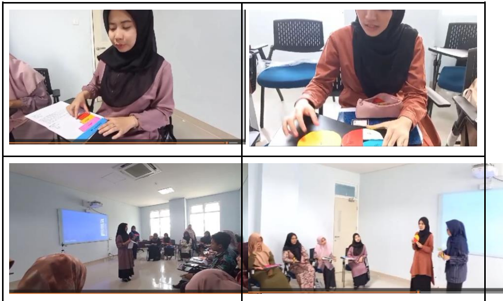
Gambar 7. presentasi media pembelajaran matematika

Setelah selesai membuat media dosen model memberikan kesempatan kepada salah satu perwakilan kelompok untuk mempresentasikan hasil kerja mereka, sementara mahasiswa yang lainnya memperhatikan penjelasan temannya, memberikan tanggapan, komentar atau saran terhadap media yang dihasilkan. diharapkan informasi yang diberikan seluruhnya sampai kepada semua mahasiswa.