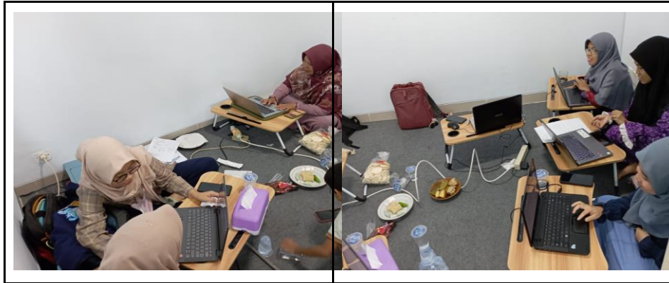
Gambar 8. Kegiatan refleksi

Berdasarkan hasil pengamatan observer dapat disimpulkan bahwa, selama proses sharing task dan jumping task berlangsung masing-masing kelompok bisa bekerja sama dengan baik mulai dari merancang prototype sampai pada tahap open class yakni membuat media pembelajaran. terdapat juga kelompok yang mengalami hambatan saat membuat media tapi dapat diselesaikan bersama oleh semua anggota kelompok mereka dengan menerapkan aturan lesson study .