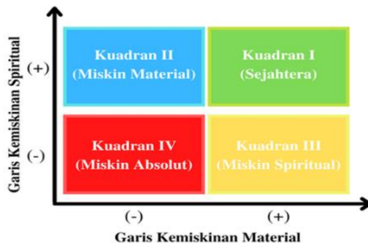
Gambar 1.1 Kuadran CIBEST

Berdasarkan Gambar diatas, kuadran CIBEST membagi kemampuan rumah tangga dalam memenuhi kebutuhan materiil dan spiritual menjadi dua tanda, yaitu tanda positif (+) yang berarti rumah tangga tersebut mampu memenuhi kebutuhannya dengan baik, dan tanda (-) yang berarti rumah tangga tersebut tidak mampu memenuhi kebutuhannya dengan baik. Manfaat dari kuadran CIBEST ini adalah terkait dengan pemetaan kondisi keluarga atau rumah tangga, sehingga dapat diusulkan program pembangunan yang tepat, terutama dalam mentransformasi semua kuadran yang ada agar bisa berada pada kuadran I (kuadran Sejahtera). Pada rumah tangga yang berada di kuadran ke II, maka program pengentasan kemiskinan melalui peningkatan skill dan kemampuan rumah tangga, serta pemberian akses permodalan dan pendampingan usaha, dapat secara efektif dilakukan. Sementara bagi rumah tangga di kuadran III, program yang perlu dikembangkan adalah bagaimana mengajak mereka untuk melaksanakan ajar an agama dengan lebih baik. Dan untuk rumah tangga di kuadran IV, maka yang harus dilakukan adalah memperbaiki sisi ruhiyah dan mentalnya terlebih dahulu, baru kemudian memperbaiki kondisi kehidupan ekonominya.